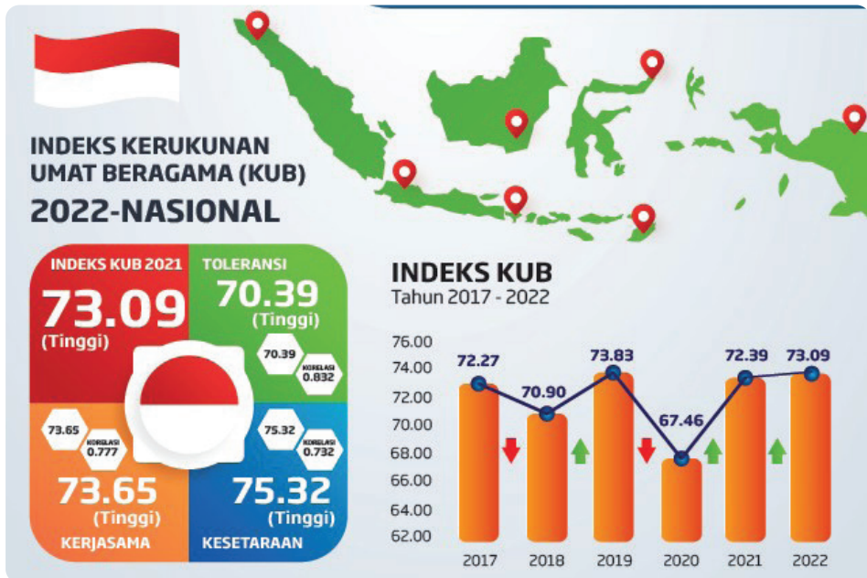
Gambar 3. Indeks Kerukunan Umat Beragama Nasional 2017-2022