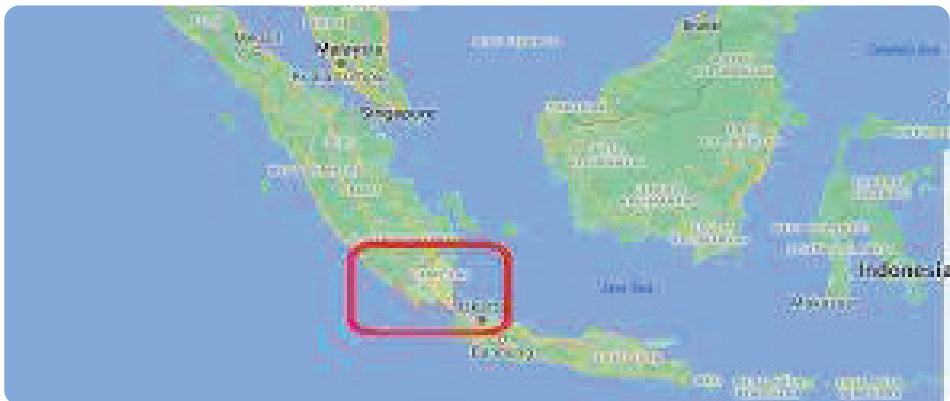
Foto. 1 Lampung dalam Peta Indonesia

Lampung merupakan provinsi yang terletak di ujung paling tenggara Pulau Sumatera. Provinsi Lampung meliputi areal dataran seluas 33.553,55 Km 2 . Secara astronomis, Provinsi Lampung terletak antara 103 0 40 ' sampai 105 0 50 ' Bujur Timur dan 6 0 45 ' sampai 3 0 45 ' Lintang Selatan. Di sebelah utara, Provinsi Lampung berbatasan dengan Provinsi Selatan dan Bengkulu, di sebelah timur dengan Laut Jawa, di sebelah selatan dengan Selat Sunda, dan di sebelah barat dengan Samudra Indonesia.